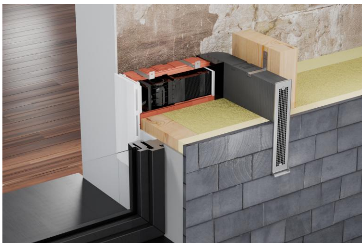
RotationVent RV 2 integriert in Fassadenelement

Die Serielle Sanierung ist eine energetische Sanierung von Bestandsgebäuden mit bauseits vorgefertigten Fassadenelementen inklusive der dazugehörigen Anlagentechnik.