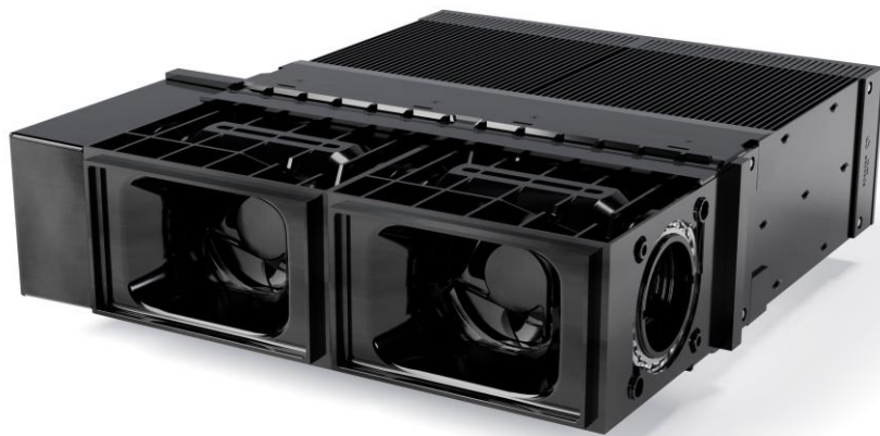
Ventilatoreinheit RotationVent RV 2

Die ästhetisch ansprechende Außenblende macht das RotationVent RV 2 perfekt für eine dezente Platzierung unter der Fensterbank. Aber auch eine Platzierung oberhalb des Fensters ist beispielsweise möglich. Alternativ zum horizontalen Einbau kann das RotationVent RV 2 auch vertikal links oder rechts des Fensters platziert werden. In der Außenblende ist eine Abtropfkante integriert, welche die Verschmutzung der Fassade verhindern soll. Als Alternative kann das Lüftungssystem auch in der Laibung platziert werden. Dabei liegt der Auslass um 90° umgelenkt auf der Außenseite innerhalb der Laibung. Die Folge ist ein noch dezenteres Erscheinungsbild. Durch die schlanke Bauform bleibt die Installation von Rolladen und Jalousie unbeeinträchtigt. Das moderne Design der Innenblende rundet das Gesamtbild ab.